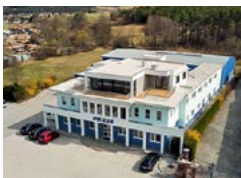
PREIS GmbH Headquarter

Josef Nitsch-Straße 5 2763 Pernitz, AT +43 (0)2632 733 55-0 office.austria@ preisgroup.com