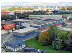
Ferro-PREIS d.o.o. Eisengießerei Grau- und Sphäroguss

Josef Nitsch-Straße 5 2763 Pernitz, AT +43 (0)2632 733 55-0 office.austria@ preisgroup.com