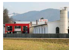
GIPRO GmbH Herstellung Gießharz-Isolatoren

Žabljak polje 52 74230 Usora, BA +387 (0)32 891 022 office.bosnia@ preisgroup.com