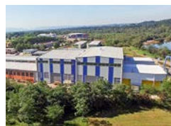
PREIS Usora d.o.o. Stahlbau und Schweiß- konstruktionen

Savska cesta 23 8290 Sevnica, SI +386 (0)781 61 852 office.slovenia@ preisgroup.com