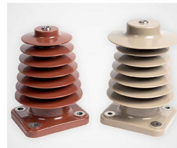
Epoxidharzisolatoren – präzise gefertigt, exakt auf die Anforderungen unserer Kunden abgestimmt.