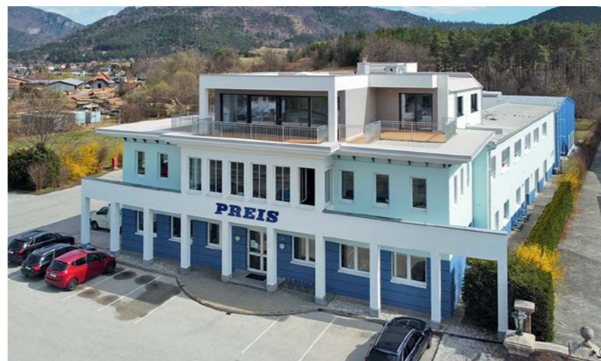
Die PREIS Gruppe (hier der Hauptsitz in Pernitz) hat sich zum europäischen Industriekonzern entwickelt.

Dieser Weg war nie gerade, aber immer konsequent. Mit jeder Expansion – ob in Kroatien, Slowenien oder Bosnien und Österreich – haben wir nicht nur Werke gebaut, sondern Kompetenzen integriert. Heute steht der Name PREIS für die Verbindung aus Tradition, Handschlagqualität und modernster Technologie.