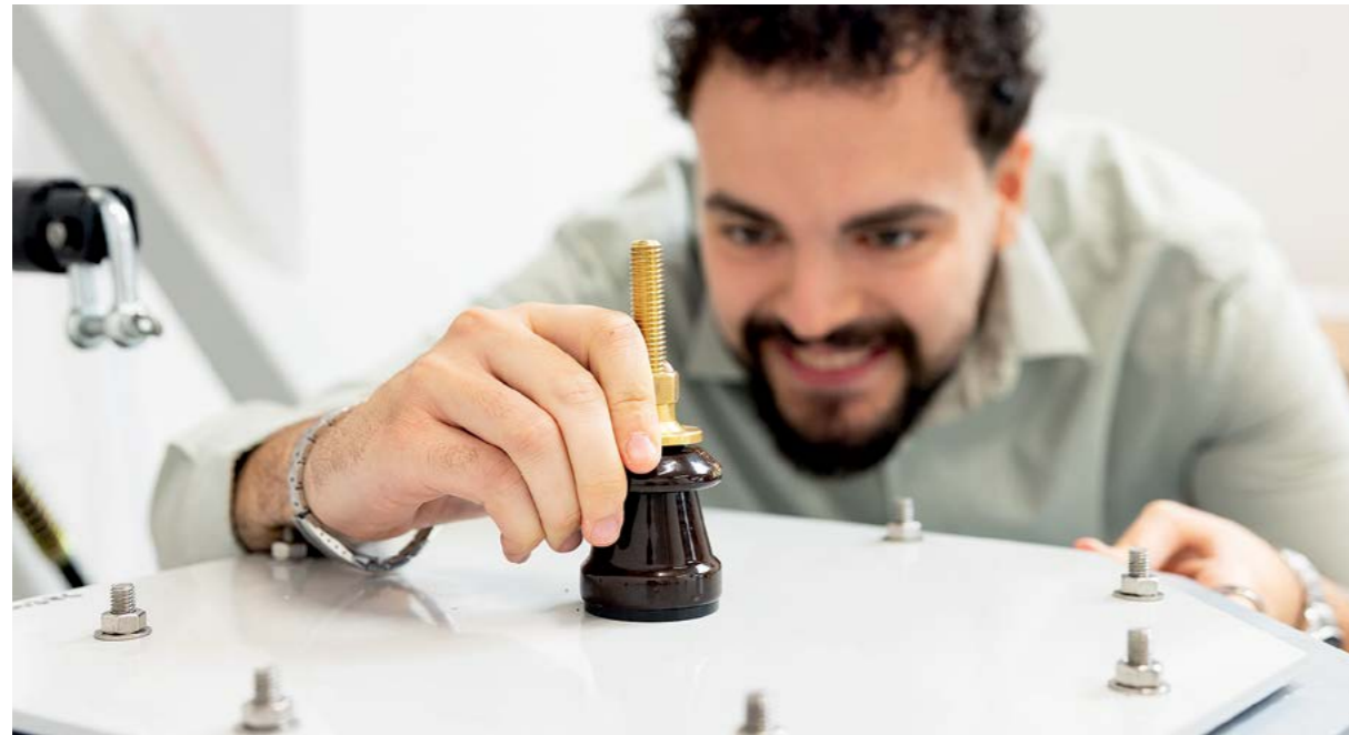
Wir garantieren für all unsere Produkte und Dienstleistungen geprüfte Sicherheit.