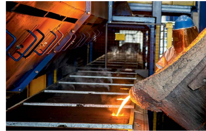
Flüssiges Eisen wird glühend in eine moderne Formanlage gegossen.