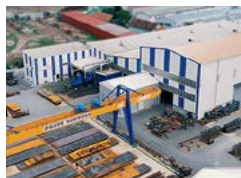
PREIS Sevnica d.o.o. Stahlbau und Schweiß- konstruktionen

Ul. dr. Tome Bratkovica 2 40000 Čakovec, HR +385 (0)40 384 206 office.croatia@ preisgroup.com